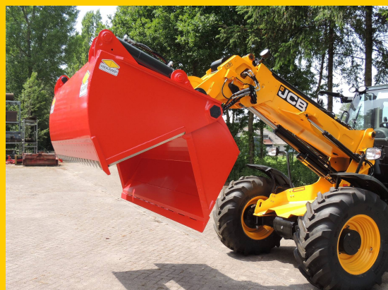
Geavanceerde Verdeelmotor ↓