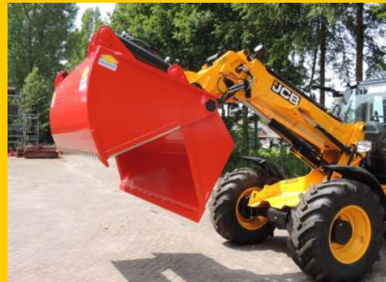
Geavanceerde Verdeelmotor ↓