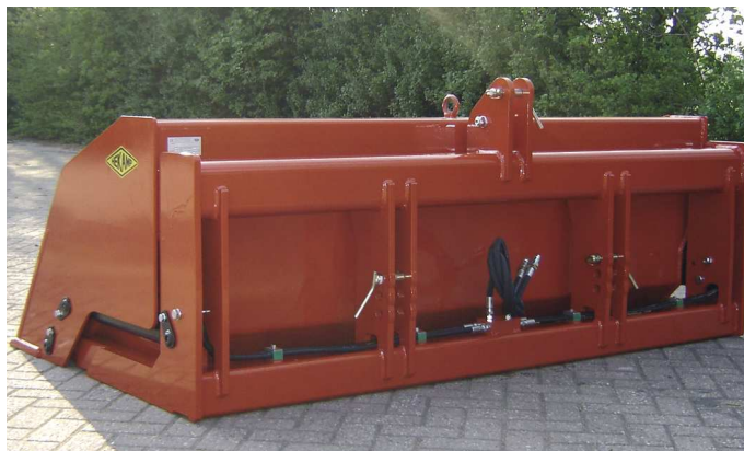
↑ HydroTwin frameaanzicht.