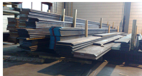
Altijd een grote voorraad Hardox®-500.

Een volkomen gecontroleerde chemische samenstelling, gevolgd door een aangepaste warmtebehandeling, geeft een uitstekende lasbaarheid.