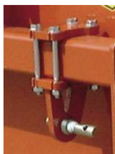
↑ Trekkerbakken, standaard met in breedte verstelbare liftblokken.