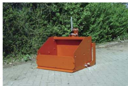
Trekkerbakken, leverbaar met eenvoudig te (de)monteren opzetschotten. Afbeelding: Mechanische Trekkerbak 90 met opzetschotten gemonteerd.