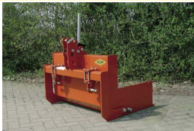
↑ Mechanische Trekkerbak 90