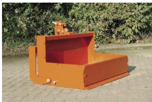
← Trekkerbakken, standaard met achterklep geleverd. Afbeelding: mechanische Trekkerbak 125