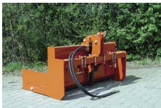
← Hydraulische Trekkerbakken, uitgevoerd met dubbelwerkende cilinder. Afbeelding: hydraulische Trekkerbak 125