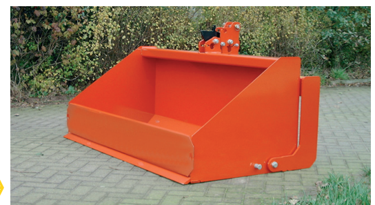
Mechanische Trekkerbak 180. Trekkerbakken t/m 180 worden met achterklep geleverd. →