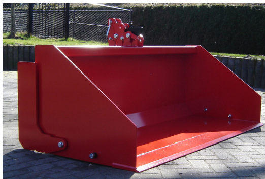
← Mechanische Trekkerbak 200