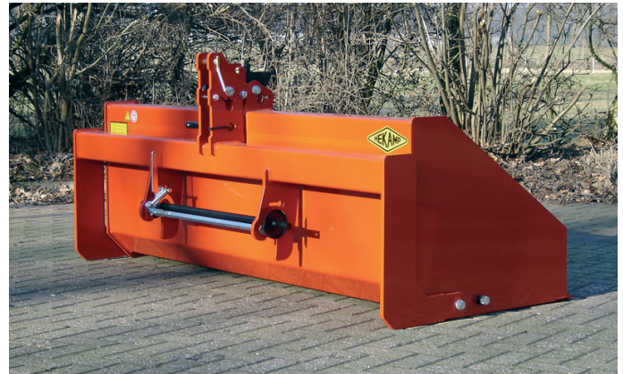
↑ Mechanische Trekkerbak 200