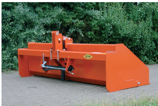
← Hydraulische Trekkerbak 250.