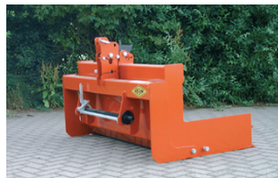
↑ De mechanische Trekkerbak 150 is als enige uitgevoerd met 'vlakke' zijplaten.